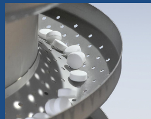
Verschiedene Wendeloberflächen auf Anfrage als Option erhältlich