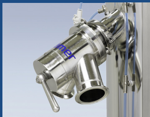
Optionaler Produkt-Verteiler KV2010