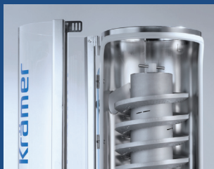
Schwenk- und entfernbares Sichtfenster